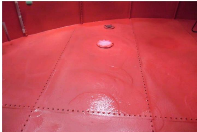
Đã hoàn thành lớp lót bên trong